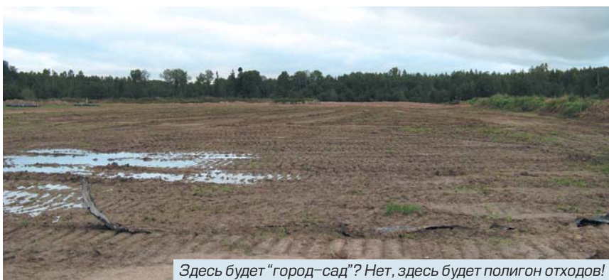
Здесь будет "город-сад"? Нет, здесь будет полигон отходов!

разом, любое загрязнение здесь водоносного слоя будет распространяться на огромные площади. Кроме того, дорога для машин с мусором проходит по границам нескольких садоводств. Для самого же полигона выбрано единственное поле, где еще сохранились лечебные травы и места для сбора ягод.