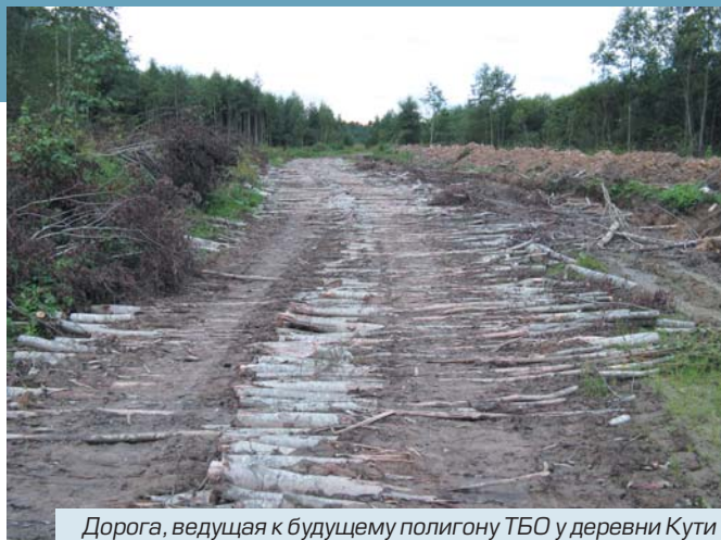
Дорога, ведущая к будущему полигону ТБО у деревни Кути

Садоводы уже несколько лет бьют тревогу: сооружение мусорной свалки возле Пупышево может иметь катастрофические последствия для экологии близлежащих мест. Дело в том, что территория возле деревни Кути, выделенная под мусорный полигон, фактически является водоохранной зоной. Таким об-